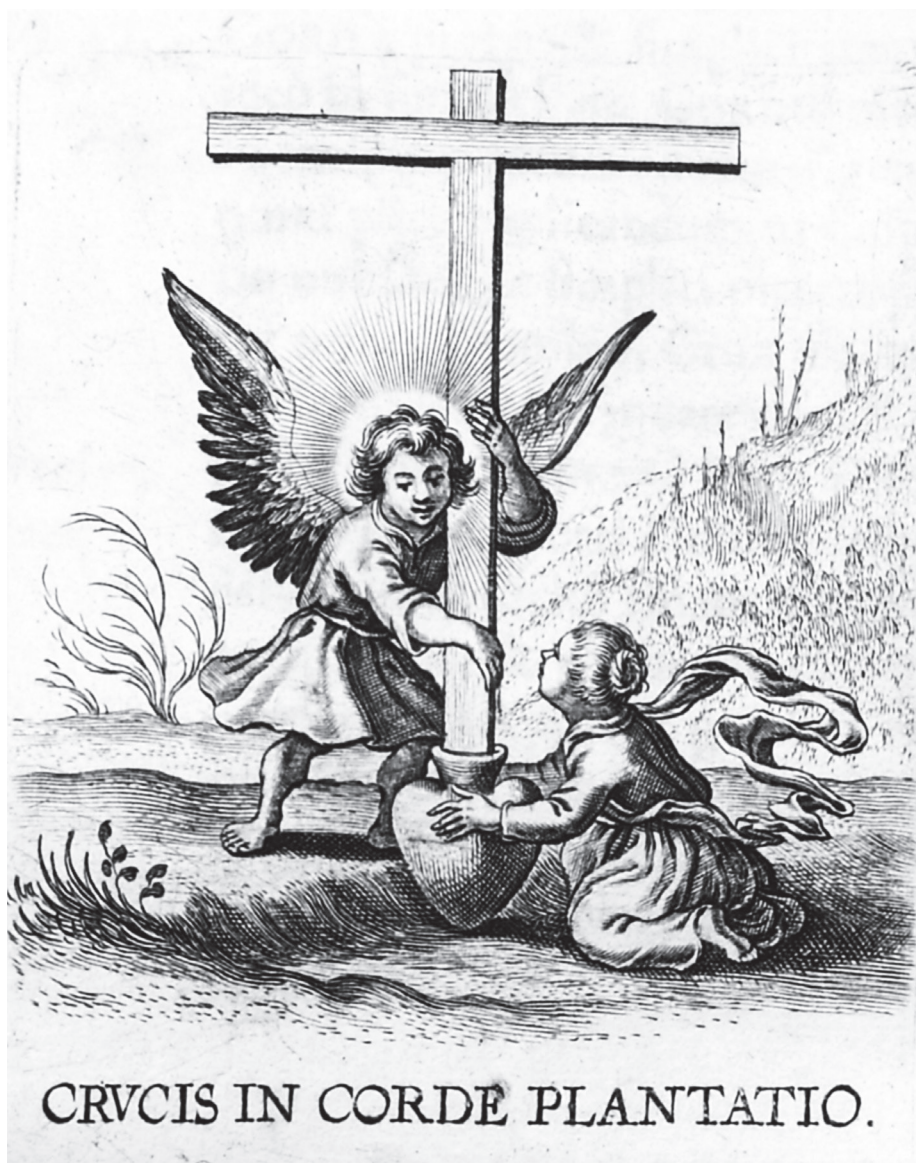
1. Grabado al cobre que ilustra la obra de Benedicto von Haeften († 1648) titulada Schola Cordis , impresa en Amberes por Enrique Verdussen en 1629 y en 1635 que contiene unos sugerentes grabados de Boccio Bolswert.